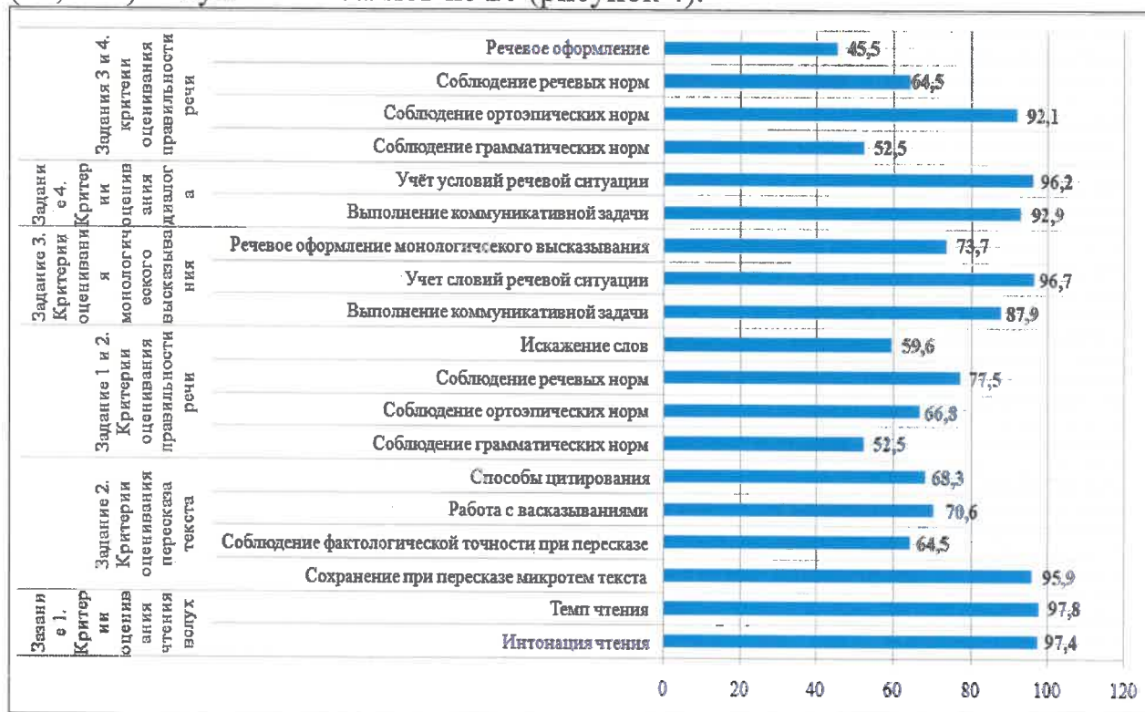
Рис. 3. Распределение участников итогового собеседования по критериям выполнения заданий, %

Распределение участников итогового собеседования по сумме баллов позволяет сделать вывод о том, что максимальное количество участников (12,44%) получили 16 баллов из 20 (рисунок 4).