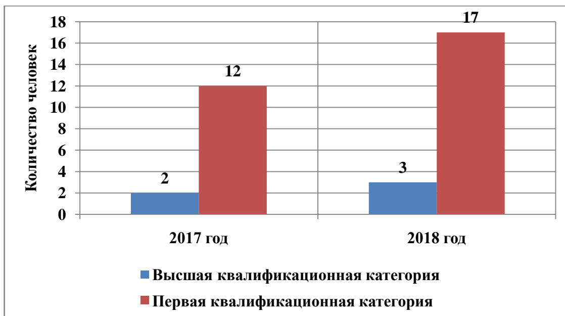
Рис. 1. Распределение педагогических работников по категориям

85,3% педагогических работников - первая квалификационная категория.