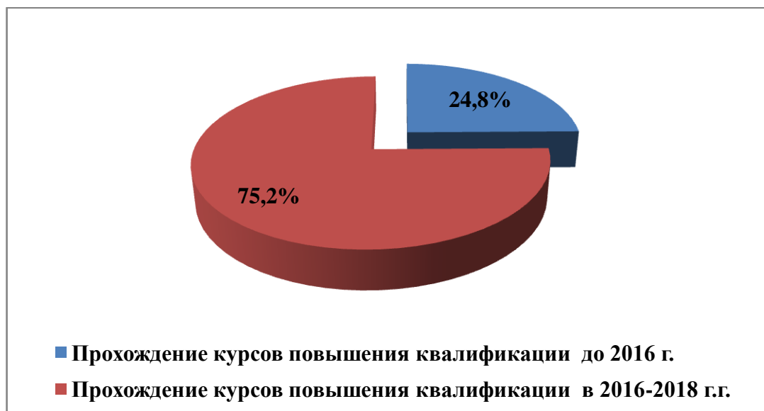
Рис.4. Распределение педагогов по срокам прохождения аттестации

Следует отметить, что в школах с НОР более 24,8% педагогов не проходили курсы повышения квалификации в 2016 - 2018 годах, в то время как 75,2% педагогов повысили свою квалификацию в данный период (Рис.4).