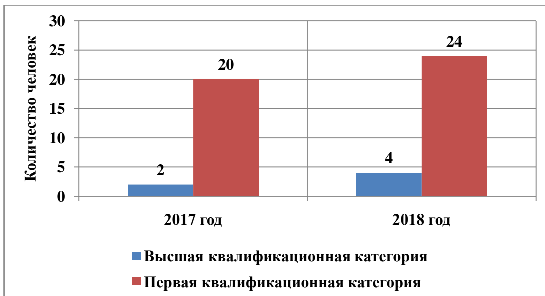
Рис. 1. Распределение педагогических работников по категориям

86% педагогических работников - первая квалификационная категория.