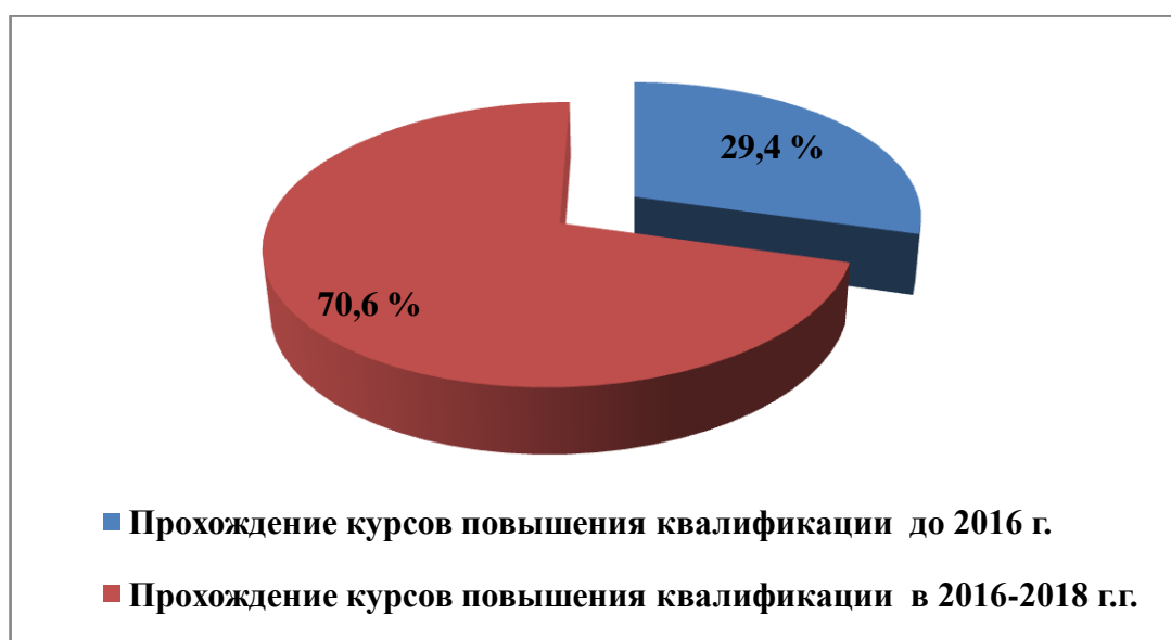
Рис.4. Распределение педагогов по срокам прохождения аттестации

Следует отметить, что в школах с НОР более 29% педагогов не проходили курсы повышения квалификации в 2016 - 2018 годах, в то время как 70,6% педагогов повысили свою квалификацию в указанный временной период (рис.4).